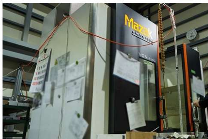
マシニングセンター